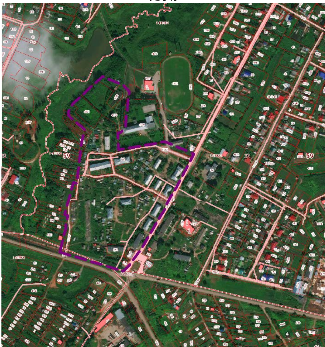
Схема для разработки проекта внесения изменений в проект планировки и проект межевания части территории д. Петровка Култаевского сельского поселения Пермского муниципального района Пермского края, утвержденные постановлением администрации Пермского муниципального района от 18.07.2016 № 345